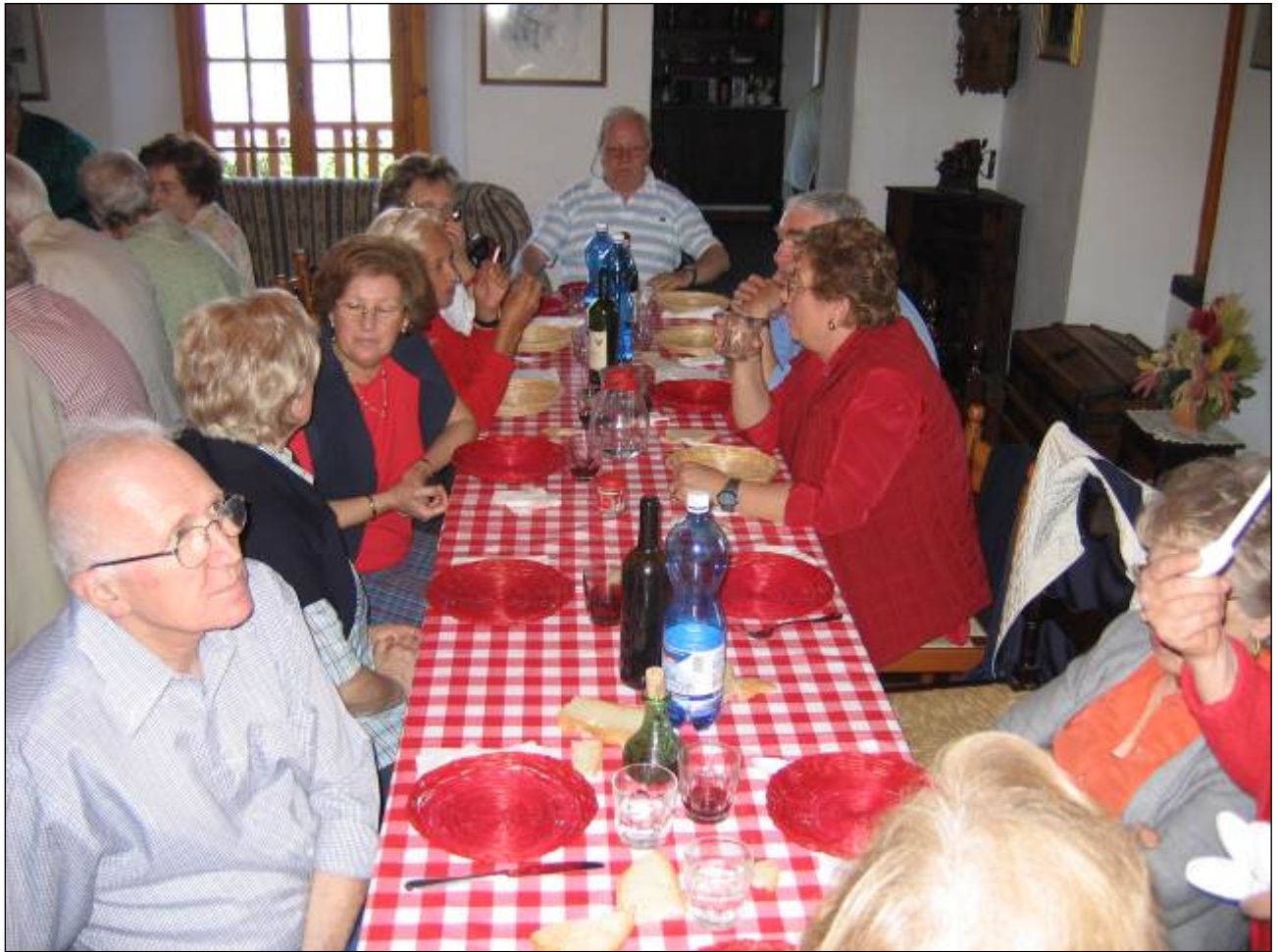
Rientriamo verso le 18.