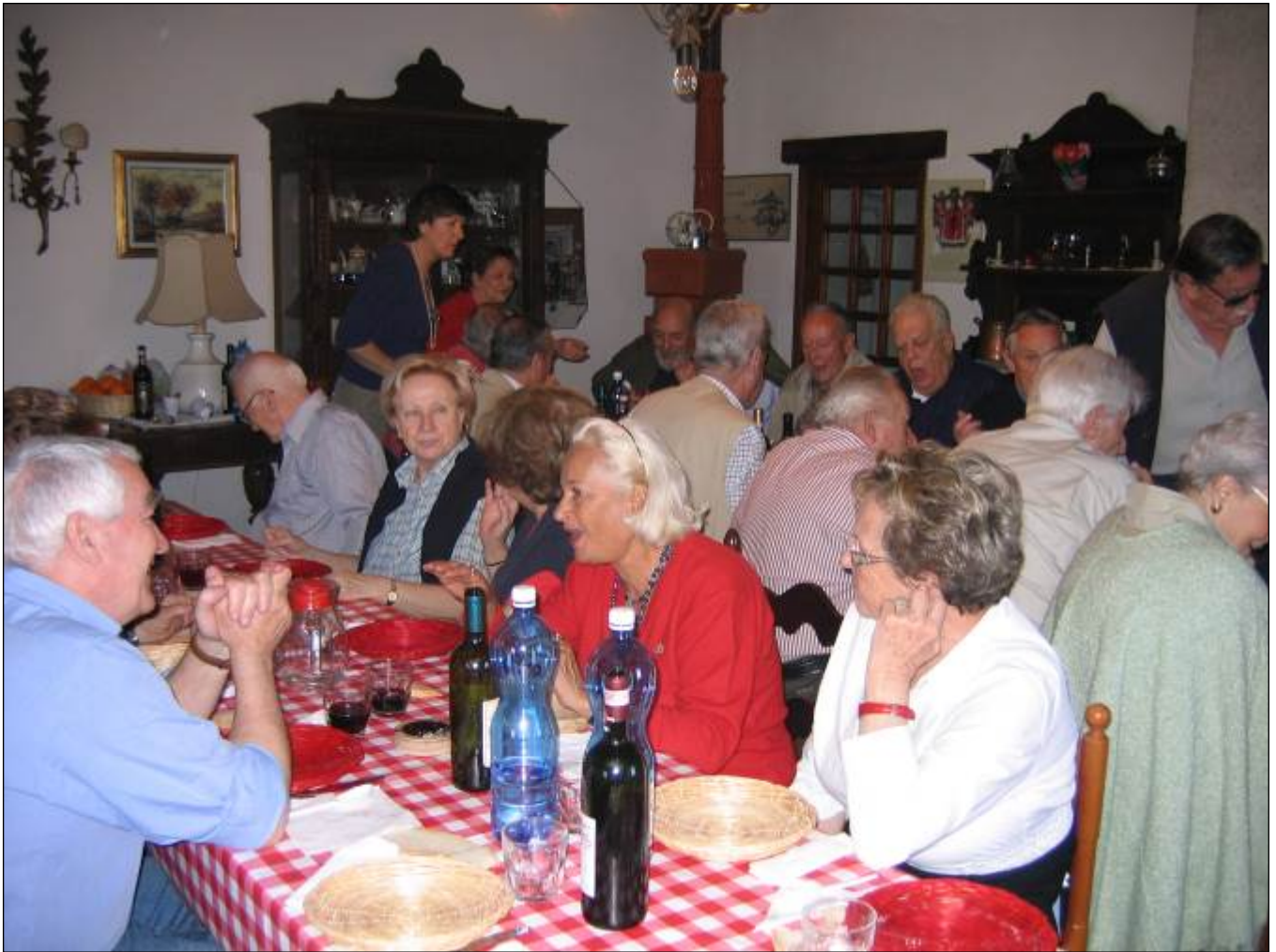
TV. Ancora foto da attaccare, cena leggerissima.